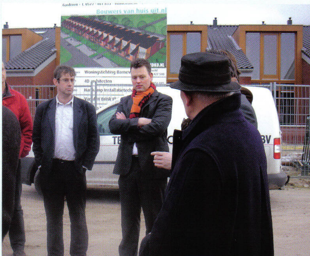
Bezoek van een delegatie van de provincie Gelderland aan Blankensgoed, in het bijzonder aan het project met de starterswoningen.